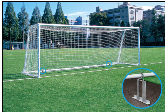
RT-F010996 サッカーゴール固定金具